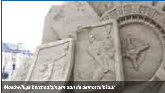
Moedwillige beschadigingen aan de demoscultuur

In de nacht van vorige week zaterdag op zondag hebben vandalen vernielingen aangericht aan vijf van de negen zandsculpturen die verspreid door het centrum staan. De kunstenaars zijn dinsdag teruggekomen en hebben gelukkig alle beelden kunnen herstellen, maar uiteraard zijn daar kosten aan verbonden.